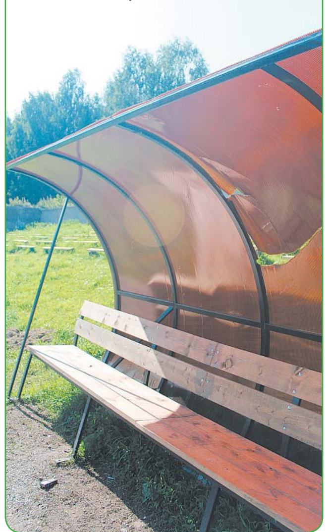
Навес над скамьей разбит. Зачем?